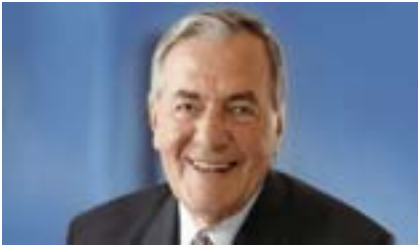
Hilmar Kopper Vorsitzender des Aufsichtsrats

Einen Schwerpunkt der Sitzung im Juli bildete neben den Personalentscheidungen im Vorstand der Halbjahresbericht. In diesem Zusammenhang wurden auch der Geschäftsverlauf und die Strategie des Geschäftsfeldes Financial Services eingehend dargestellt. Der Beantragung einer Teilbanklizenz in den USA durch DaimlerChrysler Financial Services wurde zugestimmt. Ein weiterer Bestandteil der Sitzung waren Informationen zur Beauftragung der KPMG Deutsche Treuhand-Gesellschaft Aktiengesellschaft, Wirtschaftsprüfungsgesellschaft, mit der Abschlussprüfung und die dabei vom Prüfungsausschuss mit dem Abschlussprüfer vereinbarten Prüfungsschwerpunkte. Zusätzlich erörterte der Aufsichtsrat die Auswirkungen der zuvor schriftlich genehmigten Überbrückungsfinanzierung für einen insolventen Zulieferer sowie verschiedene konzerninterne, gesellschaftsrechtliche Restrukturierungen in Nordamerika.